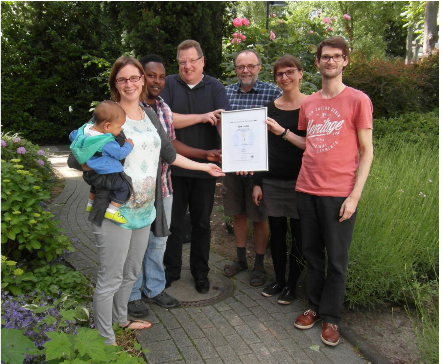
Der Güteausschuss am 10. Juni 2016 in Köln mit der erhaltenen Markenurkunde vom Deutschen Patent- und Markenamt in München (nicht auf dem Foto sind Anna Steinacher und Sebastian Koppers)