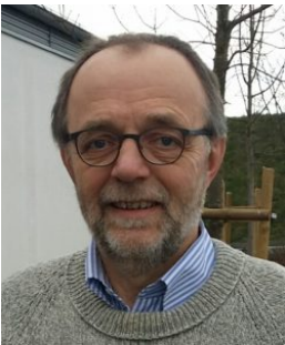
© privat Peter Nilles ( SoFiA e.V. )