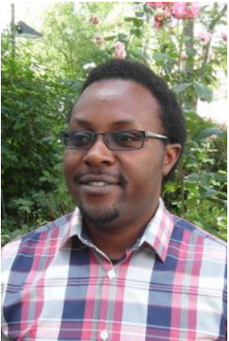
© Gütegemeinschaft Innocent Sahinkuye ( Inshuti e.V. - Partnerschaft Haus Wasserburg/KSJ Trier mit der Pfarrei Matimba-Ruanda )